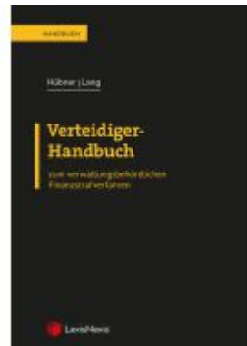
Verteidiger-Handbuch Ladenpreis: 54,00EUR