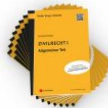
PAKET Lehrbuchreihe Zivilrecht I - VIII Ladenpreis: 250,00EUR