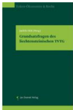
Grundsatzfragen des Liechtensteinischen TVTG Ladenpreis: 98,00EUR