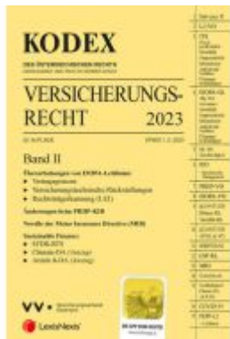
KODEX Versicherungsrecht Band II 2023 - inkl. App Ladenpreis: 62,00EUR

Wir haben andere Produkte gefunden, die Ihnen gefallen könnten!