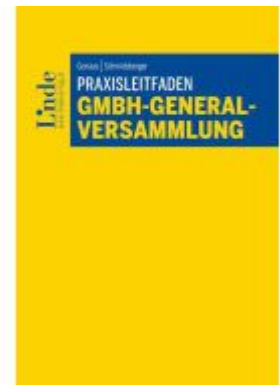
Praxisleitfaden GmbH- Generalversammlung Ladenpreis: 49,00EUR