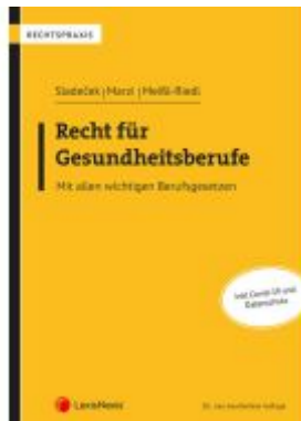
Recht für Gesundheitsberufe Ladenpreis: 48,00EUR