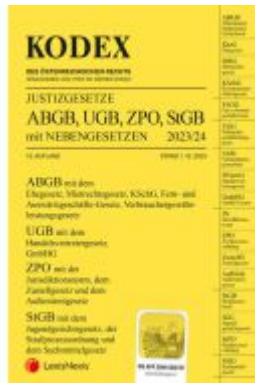
KODEX Justizgesetze 2023/24 - inkl. App Ladenpreis: 34,00EUR