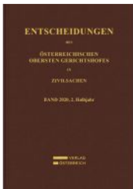
Entscheidungen des Obersten Gerichtshofes in Zivilsachen Ladenpreis: 208,00EUR