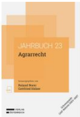
Agrarrecht Ladenpreis: 78,00EUR