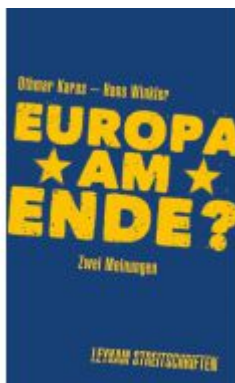
Europa am Ende? Zwei Meinungen Ladenpreis: 9,90 EUR