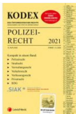
KODEX Polizeirecht 2021 Ladenpreis: 58,00 EUR