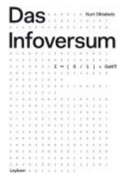
Das Infoversum Ladenpreis: 35,00 EUR