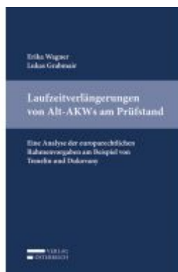
Laufzeitverlängerungen von Alt-AKW am Prüfstand Ladenpreis: 45,00 EUR