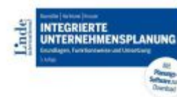
Integrierte Unternehmensplanung Ladenpreis: 65,00 EUR