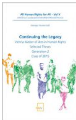
Continuing the Legacy Ladenpreis: 58,00 EUR