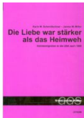
Die Liebe war stärker als das Heimweh Ladenpreis: 17,90 EUR