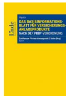
Das Basisinformationsblatt für Versicherungsanlageprodukte nach der PRIIP-Verordnung Ladenpreis: 48,00 EUR