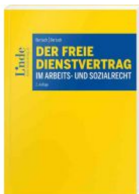
Der freie Dienstvertrag im Arbeits- und Sozialrecht Ladenpreis: 54,00 EUR