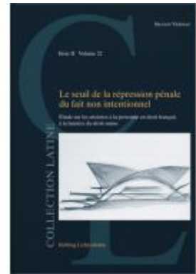
Le seuil de la répression pénale du fait non intentionnel Ladenpreis: 97,00EUR