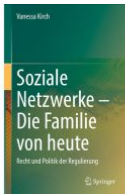
Soziale Netzwerke – Die Familie von heute Ladenpreis: 133,63EUR