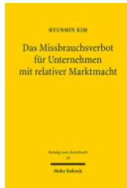
Das Missbrauchsverbot für Unternehmen mit relativer Marktmacht Ladenpreis: 81,30EUR