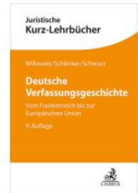
Deutsche Verfassungsgeschichte Ladenpreis: 33,90EUR