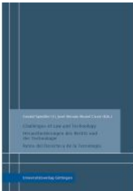
Challenges of Law and Technology - Herausforderungen des Rechts und der Technologie - Retos del Derecho y de la Tecnología Ladenpreis: 39,10EUR