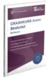
CRASHKURS Assesx Strafurteil - S2-Klausur Ladenpreis: 28,70EUR