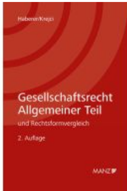
Gesellschaftsrecht Allgemeiner Teil Ladenpreis: 69,00EUR