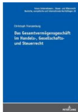
Das Gesamtvermögensgeschäft im Handels-, Gesellschafts- und Steuerrecht Ladenpreis: 82,20EUR