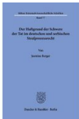
Der Haftgrund der Schwere der Tat im deutschen und serbischen Strafprozessrecht. Ladenpreis: 92,50EUR