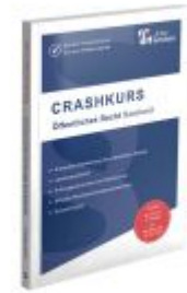
CRASHKURS Öffentliches Recht - Saarland Ladenpreis: 27,70EUR