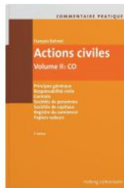
Commentaire pratique Actions civiles Ladenpreis: 240,00EUR