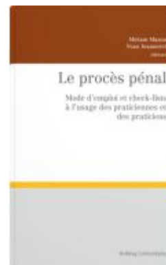
Le procès pénal Ladenpreis: 273,00EUR