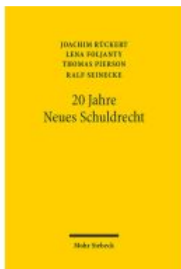
20 Jahre Neues Schuldrecht Ladenpreis: 86,40EUR