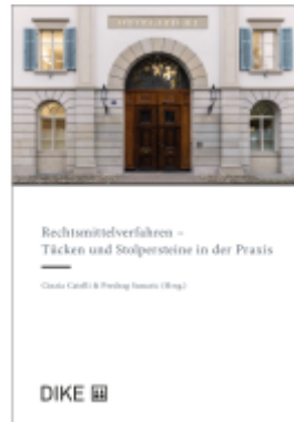
Rechtsmittelverfahren - Tücken und Stolpersteine in der Praxis Ladenpreis: 40,00EUR