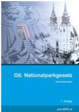
Oö. Nationalparkgesetz Ladenpreis: 20,00EUR

Wir haben andere Produkte gefunden, die Ihnen gefallen könnten!