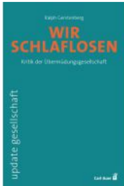
Wir Schlaflosen Ladenpreis: 14,40EUR