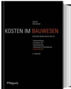
Kosten im Bauwesen Ladenpreis: 60,70EUR