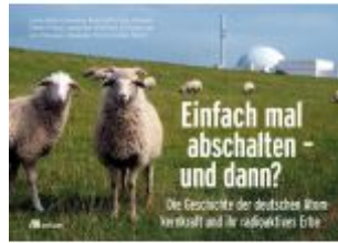
Einfach mal abschalten - und dann? Ladenpreis: 35,00EUR