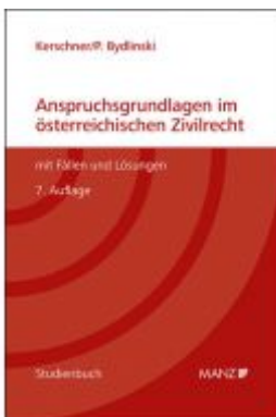
Anspruchsgrundlagen im österreichischen Zivilrecht mit Fällen und Lösungen Ladenpreis: 54,80 EUR