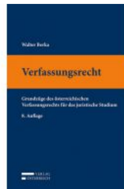
Verfassungsrecht Ladenpreis: 56,00 EUR