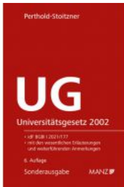
Universitätsgesetz 2002 Ladenpreis: 89,00 EUR