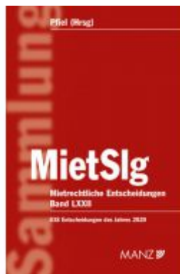
Mietrechtliche Entscheidungen MietSlg Ladenpreis: 229,00 EUR