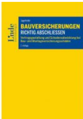
Bauversicherungen richtig abschließen Ladenpreis: 64,00 EUR