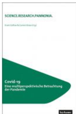
Covid-19 Eine multiperspektivische Betrachtung der Pandemie Ladenpreis: 35,00 EUR