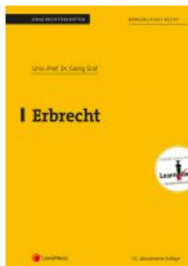
Erbrecht (Skriptum) Ladenpreis: 22,00 EUR