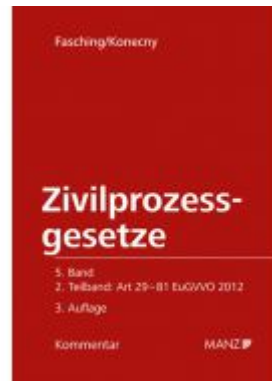
Kommentar zu den Zivilprozessgesetzen Art 29-81 EuGVVO 2012 ZPO Ladenpreis: 142,00 EUR