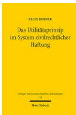
Das Utilitätsprinzip im System zivilrechtlicher Haftung Ladenpreis: 127,50EUR