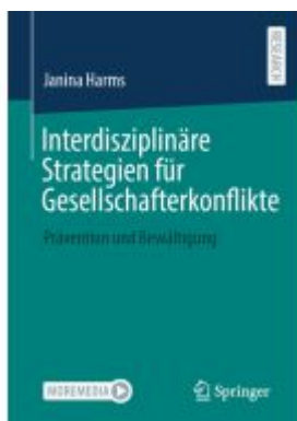
Interdisziplinäre Strategien für Gesellschafterkonflikte Ladenpreis: 92,51EUR