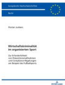
Wirtschaftskriminalität im organisierten Sport