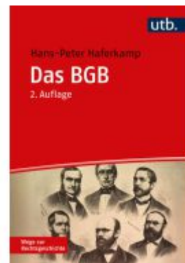
Das BGB Ladenpreis: 36,00EUR