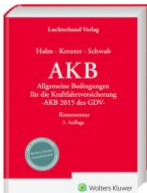
AKB Kommentar Ladenpreis: 173,80EUR

Wir haben andere Produkte gefunden, die Ihnen gefallen könnten!