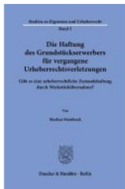
Die Haftung des Grundstückserwerbers für vergangene Urheberrechtsverletzungen.