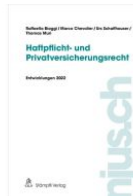
Haftpflicht- und Privatversicherungsrecht