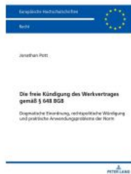
Die freie Kündigung des Werkvertrages gemäß § 648 BGB Ladenpreis: 51,40EUR