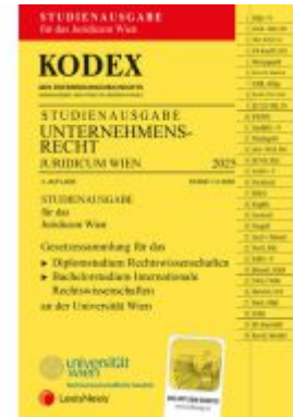
KODEX Unternehmensrecht Wien Juridicum 2025 - inkl. App Ladenpreis: 28,00EUR