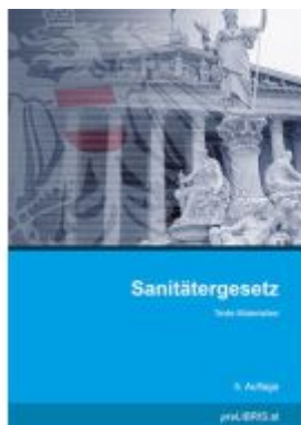
Sanitätsgesetz Ladenpreis: 26,00EUR