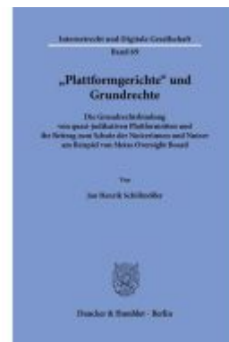
"Plattformgerichte" und Grundrechte Ladenpreis: 102,70EUR