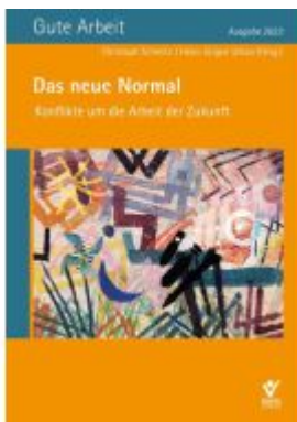
Das neue Normal – Konflikte um die Arbeit der Zukunft Ladenpreis: 47,30EUR