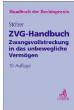
ZVG-Handbuch Ladenpreis: 101,80EUR