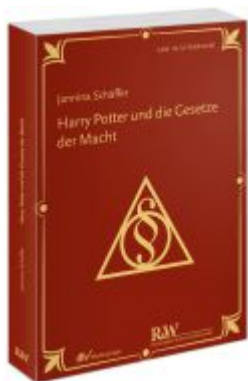
Harry Potter und die Gesetze der Macht Ladenpreis: 50,40EUR