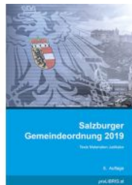
Salzburger Gemeindeordnung 2019 Ladenpreis: 26,00EUR