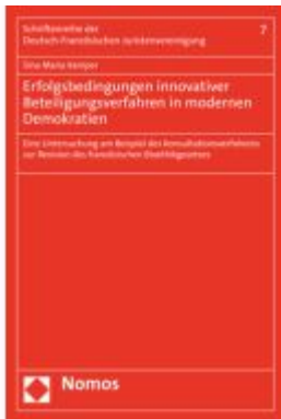
Erfolgsbedingungen innovativer Beteiligungsverfahren in modernen Demokratien Ladenpreis: 50,40EUR