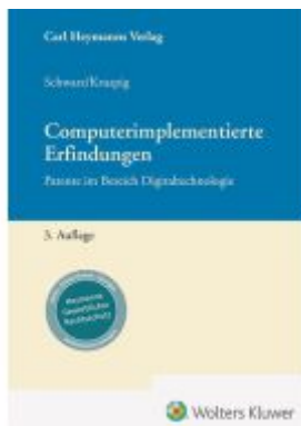
Computerimplementierte Erfindungen Ladenpreis: 142,90EUR