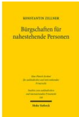
Bürgschaften für nahestehende Personen Ladenpreis: 86,40EUR