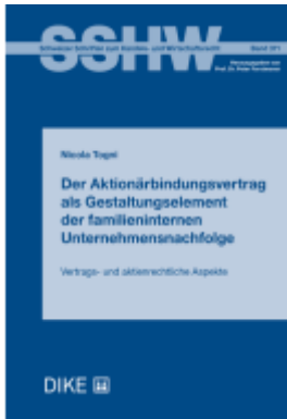
Der Aktionärsbindungsvertrag als Gestaltungselement der familieninternen Unternehmensnachfolge Ladenpreis: 104,00EUR