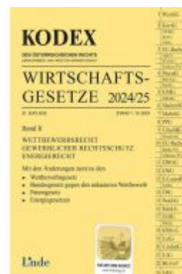
KODEX Wirtschaftsgesetze Band II 2024/25 Ladenpreis: 62,00EUR