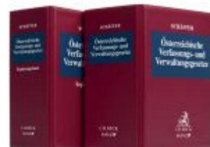
Österreichische Verfassungs- und Verwaltungsgesetze Ladenpreis: 99,00EUR