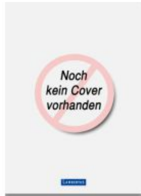
Schriftenreihe zum Kirchlichen Arbeitsrecht - Band 16 Ladenpreis: 61,60EUR