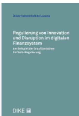
Regulierung von Innovation und Disruption im digitalen Finanzsystem am Beispiel der brasilianischen FinTech-Regulierung Ladenpreis: 126,00EUR