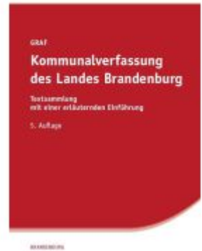
Kommunalverfassung des Landes Brandenburg Ladenpreis: 18,00EUR