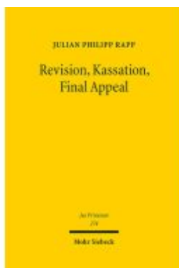
Revision, Kassation, Final Appeal Ladenpreis: 132,70EUR