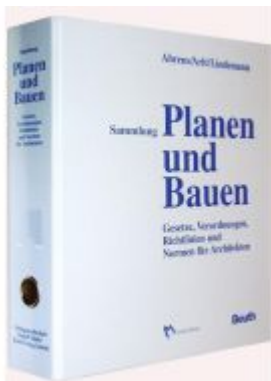
Sammlung Planen und Bauen Ladenpreis: 749,50EUR

Wir haben andere Produkte gefunden, die Ihnen gefallen könnten!