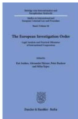
The European Investigation Order. Ladenpreis: 92,50EUR