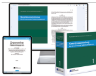
Gesetzessammlung für die kommunale Vollstreckungspraxis – Print + Digital Ladenpreis: 206,70EUR