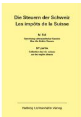
Die Steuern der Schweiz: Teil IV EL 193 Ladenpreis: 301,00EUR