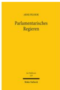
Parlamentarisches Regieren Ladenpreis: 142,90EUR