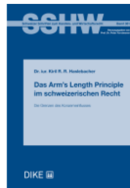
Das Arm's Length Principle im schweizerischen Recht Ladenpreis: 108,00EUR