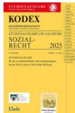
KODEX Studienausgabe Sozialrecht Salzburg 2025 Ladenpreis: 12,00EUR