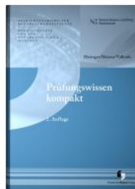
Prüfungswissen kompakt Ladenpreis: 25,60EUR