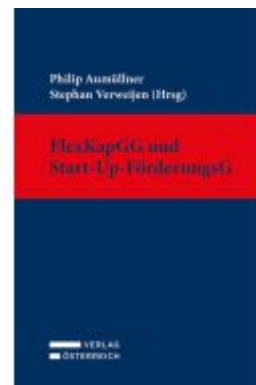
FlexKapGG und Start-Up-FörderungsG Ladenpreis: 149,00EUR