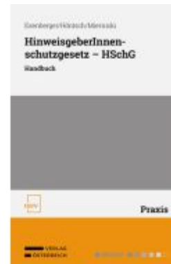
HinweisgeberInnen-schutzgesetz – HSchG Ladenpreis: 78,00EUR