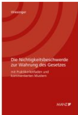
Die Nichtigkeitsbeschwerde zur Wahrung des Gesetzes Ladenpreis: 48,00EUR