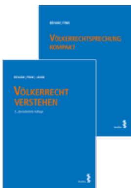
Kombipaket Völkerrecht verstehen und Völkerrechtsprechung kompakt