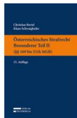
Österreichisches Strafrecht. Besonderer Teil II (§§ 169 bis 321k StGB)