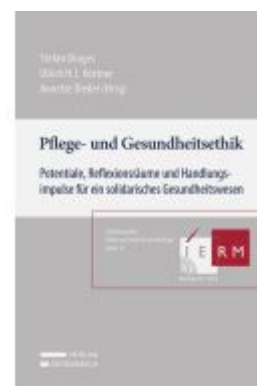
Pflege- und Gesundheitsethik Ladenpreis: 59,00EUR