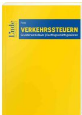
Verkehrssteuern Ladenpreis: 29,00EUR