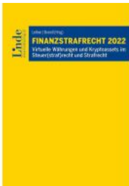
Finanzstrafrecht 2022 Ladenpreis: 59,00EUR