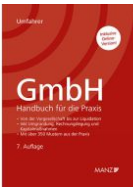
GmbH - Handbuch für die Praxis Ladenpreis: 278,00EUR