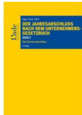
Der Jahresabschluss nach dem Unternehmensgesetzbuch, Band 2 Ladenpreis: 90,00EUR