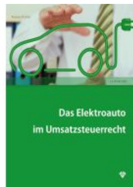
Das Elektroauto im Umsatzsteuerrecht Ladenpreis: 24,00EUR