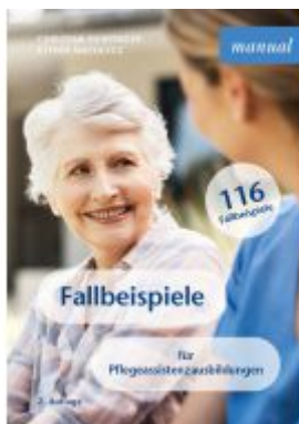
Fallbeispiele Ladenpreis: 22,90EUR