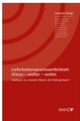
Lieferkettenverantwortlichkeit Wieso - woher - wohin Ladenpreis: 48,00EUR