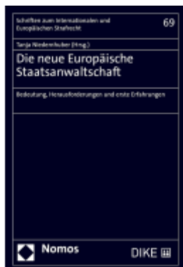
Die neue Europäische Staatsanwaltschaft Ladenpreis: 48,00EUR