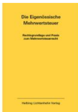
Die Eidgenössische Mehrwertsteuer EL 51 Ladenpreis: 196,00EUR