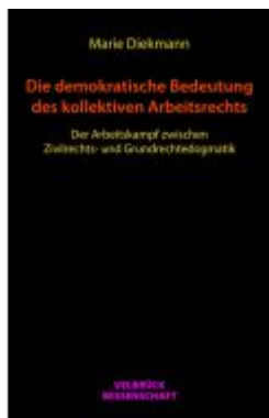
Die demokratische Bedeutung des kollektiven Arbeitsrechts Ladenpreis: 44,90EUR