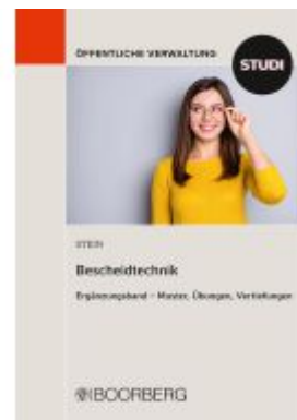
Bescheidtechnik Ladenpreis: 23,50EUR