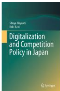
Digitalization and Competition Policy in Japan Ladenpreis: 109,99EUR