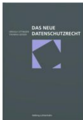
Das neue Datenschutzrecht Ladenpreis: 53,00EUR