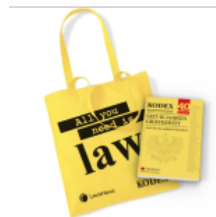
KODEX Fan-Package „All you need is LAW“ Ladenpreis: 15,00EUR