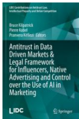
Antitrust in Data Driven Markets & Legal Framework for Influencers, Native Advertising and Control over the Use of AI in Marketing Ladenpreis: 252,99EUR