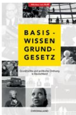
Basiswissen Grundgesetz Ladenpreis: 20,40EUR