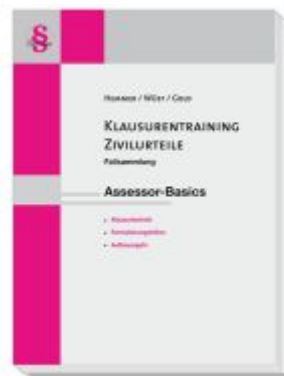
Klausurentraining Zivilurteile Assessor- Basics Ladenpreis: 25,60EUR