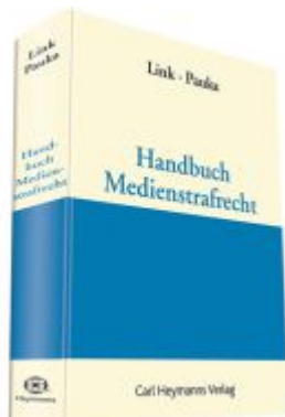
Handbuch Medienstrafrecht Ladenpreis: 113,10EUR

Wir haben andere Produkte gefunden, die Ihnen gefallen könnten!