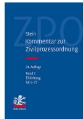
Kommentar zur Zivilprozessordnung Ladenpreis: 400,00EUR