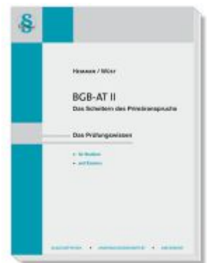
BGB-AT II - Das Scheitern des Primäranspruchs Ladenpreis: 23,60EUR