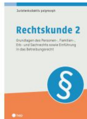
Rechtskunde 2 (Print inkl. E-Book Edubase, Neuaufgabe 2024) Ladenpreis: 64,80EUR