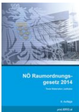
NÖ Raumordnungsgesetz 2014 Ladenpreis: 28,00EUR