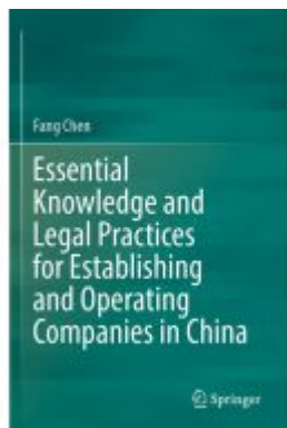
Essential Knowledge and Legal Practices for Establishing and Operating Companies in China Ladenpreis: 109,99EUR