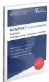
KOMPAKT Landesrecht - Sachsen Ladenpreis: 25,60EUR

Wir haben andere Produkte gefunden, die Ihnen gefallen könnten!