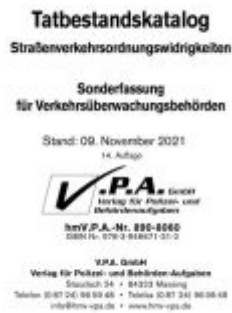
15. Ergänzungslieferung zum Bundeseinheitlicher Tatbestandskatalog, Sonderfassung für Verkehrsüberwachung Ladenpreis: 10,50EUR