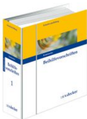
Beihilfavorschriften Ladenpreis: 285,80EUR