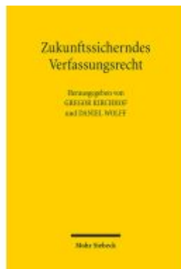
Zukunftssicherndes Verfassungsrecht Ladenpreis: 81,30EUR