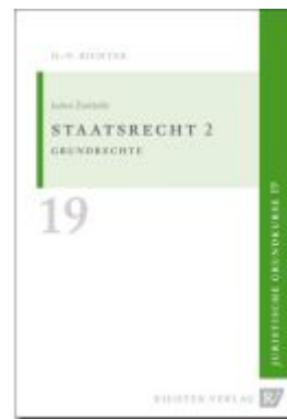
Juristische Grundkurse / Band 19 - Staatsrecht 2 Ladenpreis: 11,10EUR