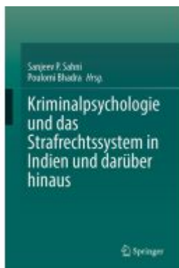
Kriminalpsychologie und das Strafrechtssystem in Indien und darüber hinaus Ladenpreis: 82,23EUR