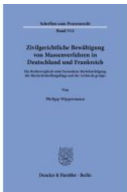
Zivilgerichtliche Bewältigung von Massenverfahren in Deutschland und Frankreich Ladenpreis: 92,50EUR