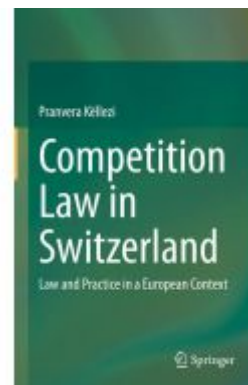
Competition Law in Switzerland Ladenpreis: 98,99EUR