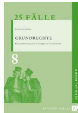
25 Fälle - Band 8 - Grundrechte Ladenpreis: 11,10EUR