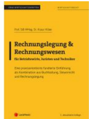
Rechnungslegung & Rechnungswesen für Betriebswirte, Juristen und Techniker Ladenpreis: 28,75EUR