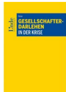
Gesellschafterdarlehen in der Krise Ladenpreis: 34,00EUR