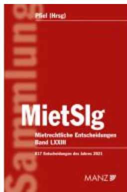
Mietrechtliche Entscheidungen MietSlg Ladenpreis: 238,00EUR