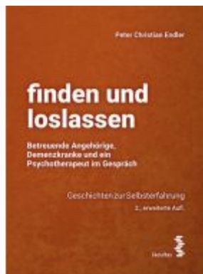
finden und loslassen Betreuende Angehörige, Demenzerkrankte und ein Psychotherapeut im Gespräch