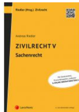
Zivilrecht V - Sachenrecht