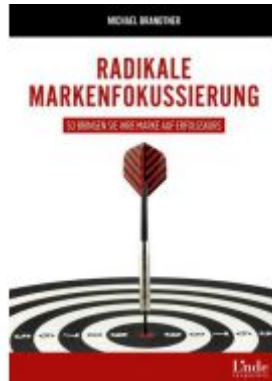
Radikale Markenfokussierung Ladenpreis: 29,90EUR