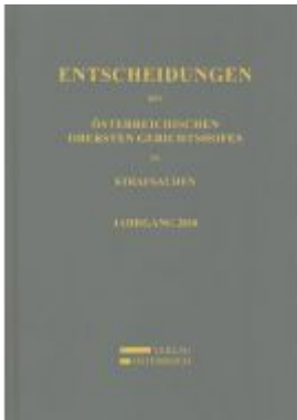
Entscheidungen des Osterreichischen Obersten Gerichtshofes in Strafsachen Ladenpreis: 168,00EUR