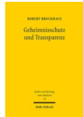
Geheimnisschutz und Transparenz Ladenpreis: 117,20EUR