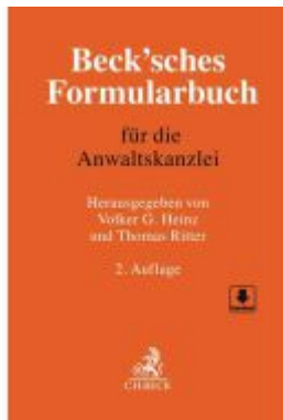
Beck'sches Formularbuch für die Anwaltskanzlei Ladenpreis: 194,30EUR