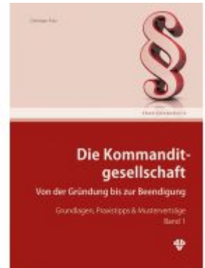
Die Kommanditgesellschaft Band 1 Ladenpreis: 78,00EUR