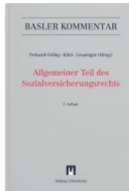
Allgemeiner Teil des Sozialversicherungsrechts (ATSG) Ladenpreis: 416,00EUR