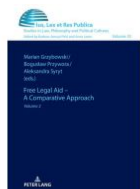
Free Legal Aid – A Comparative Approach Ladenpreis: 51,40EUR