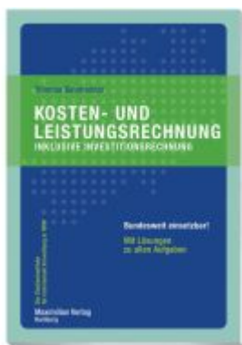
Kosten- und Leistungsrechnung inklusive Investitionsrechnung Ladenpreis: 25,70EUR