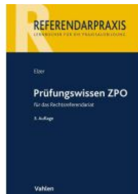
Prüfungswissen ZPO für das Rechtsreferendariat Ladenpreis: 41,00EUR