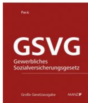
Die Sozialversicherung der in der gewerblichen Wirtschaft selbständig Erwerbstätigen - GSVG Ladenpreis: 298,00 EUR