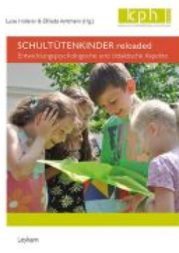
Schultütenkinder reloaded Ladenpreis: 25,00 EUR