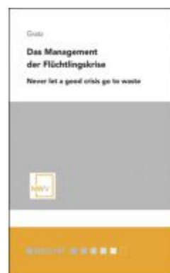
Das Management der Flüchtlingskrise Ladenpreis: 29,80 EUR