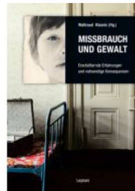
Missbrauch und Gewalt Ladenpreis: 21,00 EUR