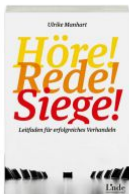
Höre-rede-siege! Ladenpreis: 19,90 EUR