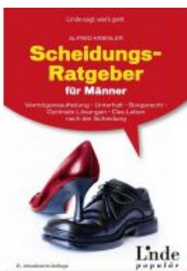
Scheidungs-Ratgeber für Männer Ladenpreis: 19,90 EUR