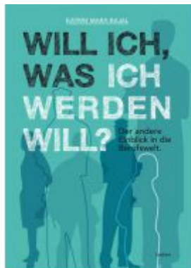
Will ich, was ich werden will? Ladenpreis: 9,90 EUR