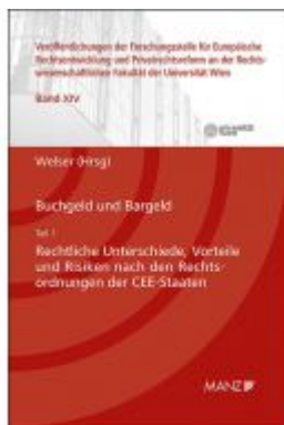
Buchgeld und Bargeld - Teil 1: Rechtliche Unterschiede und Risiken nach den Rechtsordnungen der CEE-Staaten Ladenpreis: 64,00 EUR