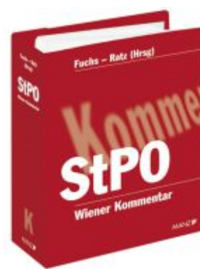
Wiener Kommentar zur StPO Ladenpreis: 478,00EUR