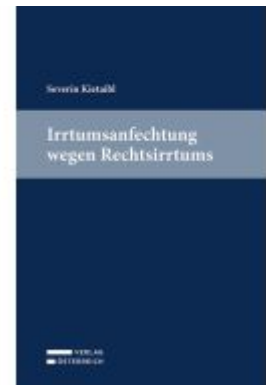
Irrtumsanfechtung wegen Rechtsirrtums Ladenpreis: 59,00EUR