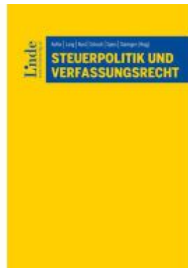
Steuerpolitik und Verfassungsrecht Ladenpreis: 75,00EUR