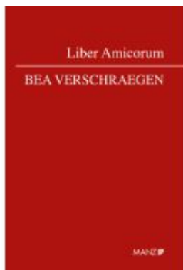
Liber Amicorum Bea Verschraegen Ladenpreis: 74,00EUR

Wir haben andere Produkte gefunden, die Ihnen gefallen könnten!