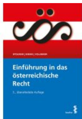
Einführung in das österreichische Recht Ladenpreis: 25,00EUR