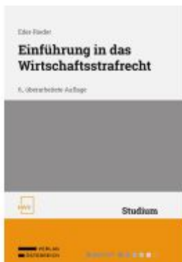
Einführung in das Wirtschaftsstrafrecht Ladenpreis: 48,00EUR