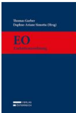
Exekutionsordnung Ladenpreis: 519,00EUR