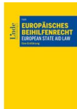
Europäisches Beihilfenrecht I European State Aid Law Ladenpreis: 49,00EUR