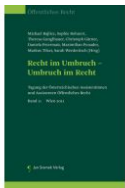
Recht im Umbruch - Umbruch im Recht Ladenpreis: 85,00EUR