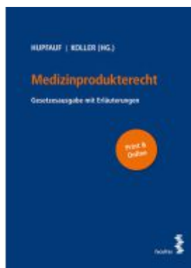
Medizinprodukterecht Ladenpreis: 58,00EUR