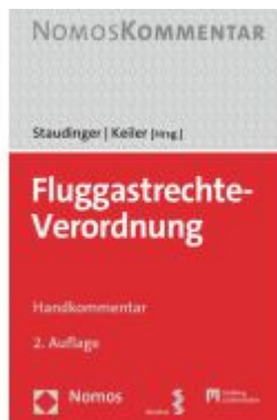
Fluggastrechte-Verordnung Ladenpreis: 80,20EUR

Wir haben andere Produkte gefunden, die Ihnen gefallen könnten!