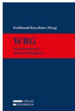
WRG - Wasserrechtsgesetz Ladenpreis: 269,00EUR