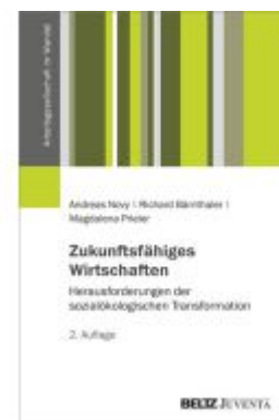
Zukunftsfähiges Wirtschaften Ladenpreis: 20,60EUR