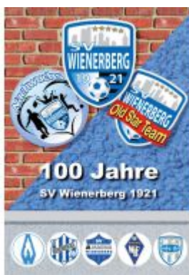
100 Jahre SV Wienerberg 1921 Ladenpreis: 28,00EUR