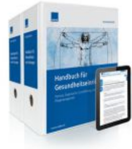
Handbuch für Gesundheitseinrichtungen Ladenpreis: 217,80 EUR