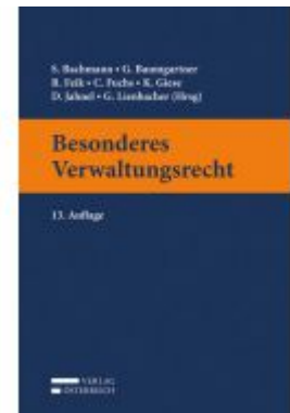
Besonderes Verwaltungsrecht Ladenpreis: 55,00 EUR