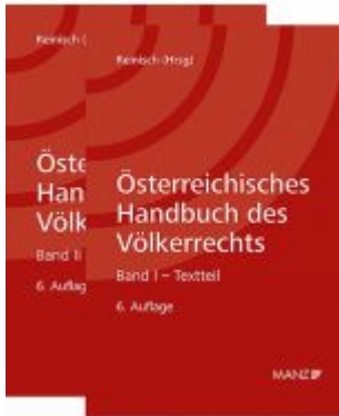
Österreichisches Handbuch des Völkerrechts Ladenpreis: 149,00 EUR