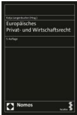
Europäisches Privat- und Wirtschaftsrecht Ladenpreis: 51,30 EUR