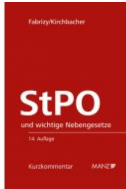
Strafprozessordnung - StPO Ladenpreis: 178,00 EUR