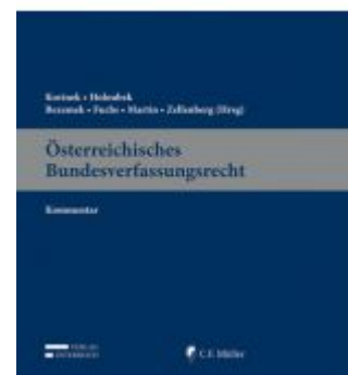
Österreichisches Bundesverfassungsrecht Ladenpreis: 329,00 EUR