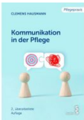
Kommunikation in der Pflege Ladenpreis: 18,90 EUR