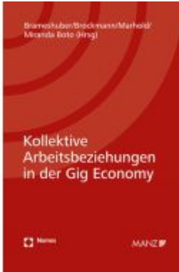
Kollektive Arbeitsbeziehungen in der Gig Economy Ladenpreis: 64,00EUR