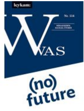
WAS – (no) future Ladenpreis: 19,00EUR