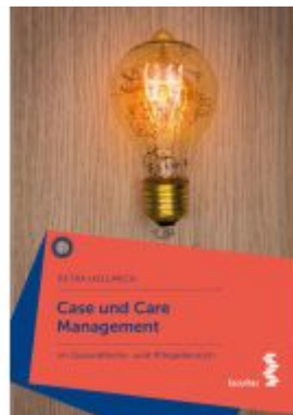
Case und Care Management Ladenpreis: 24,90EUR