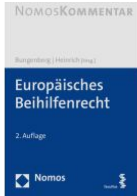
Europäisches Beihilfenrecht Ladenpreis: 256,00EUR