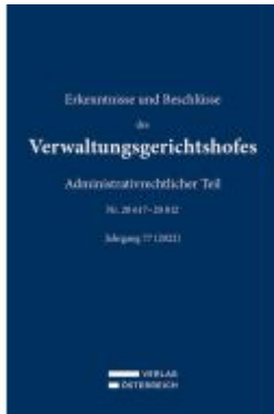
Erkenntnisse und Beschlüsse des Verwaltungsgerichtshofes Ladenpreis: 479,00EUR

Wir haben andere Produkte gefunden, die Ihnen gefallen könnten!