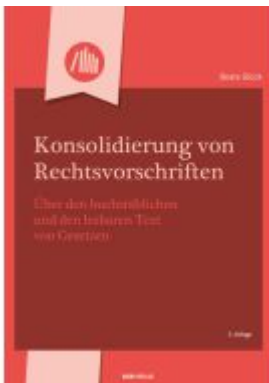
Konsolidierung von Rechtsvorschriften Ladenpreis: 36,00EUR