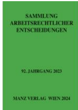
Sammlung arbeitsrechtlicher Entscheidungen Ladenpreis: 98,00EUR