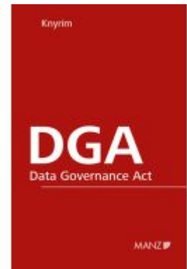
DGA - Data Governance Act Ladenpreis: 34,00EUR