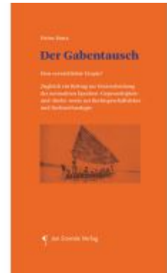
Der Gabentausch Ladenpreis: 24,90EUR