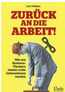
Zurück an die Arbeit! Ladenpreis: 24,90 EUR