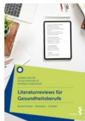
Literaturreviews für Gesundheitsberufe Ladenpreis: 26,90 EUR