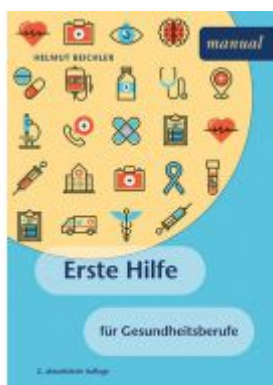
Erste Hilfe für Gesundheitsberufe Ladenpreis: 22,90 EUR