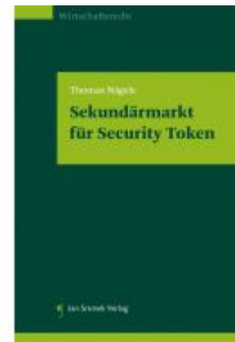
Sekundärmarkt für Security Token Ladenpreis: 29,90 EUR