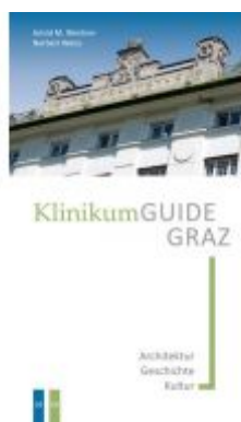
KlinikumGUIDE Graz Ladenpreis: 9,90 EUR