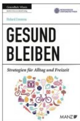
Gesund bleiben Ladenpreis: 23,90 EUR