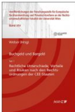
Buchgeld und Bargeld - Teil 1: Rechtliche Unterschiede und Risiken nach den Rechtsordnungen der CEE-Staaten Ladenpreis: 64,00 EUR

Wir haben andere Produkte gefunden, die Ihnen gefallen könnten!