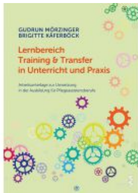
Lernbereich Training & Transfer in Unterricht und Praxis Ladenpreis: 24,90 EUR