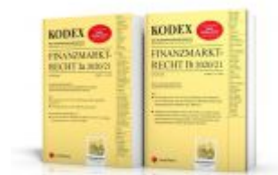
KODEX Finanzmarktrecht Band Ia + Ib 2020/21 Ladenpreis: 95,00 EUR