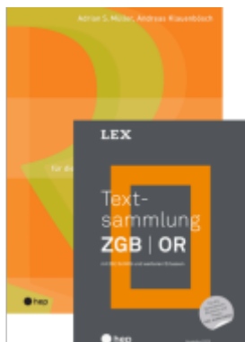
Spezialangebot «Textsammlung ZGB | OR» und «Recht» Ladenpreis: 88,50EUR