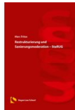
Restrukturierung und Sanierungsmoderation – StaRUG Ladenpreis: 25,70EUR