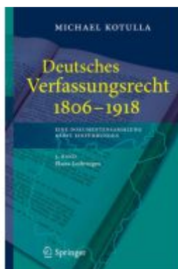
Deutsches Verfassungsrecht 1806 - 1918 Ladenpreis: 225,14EUR