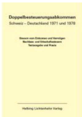
Doppelbesteuerungsabkommen Schweiz – Deutschland 1971 und 1978 EL 58 Ladenpreis: 185,00EUR