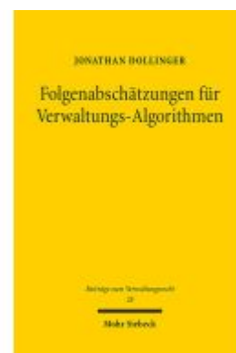
Folgenabschätzungen für Verwaltungs- Algorithmen Ladenpreis: 91,50EUR