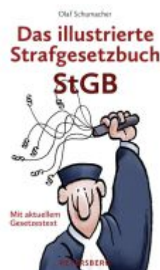
Das illustrierte Strafgesetzbuch StGB Ladenpreis: 9,95EUR