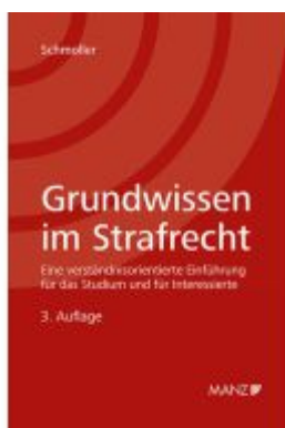
Grundwissen im Strafrecht Ladenpreis: 39,00EUR