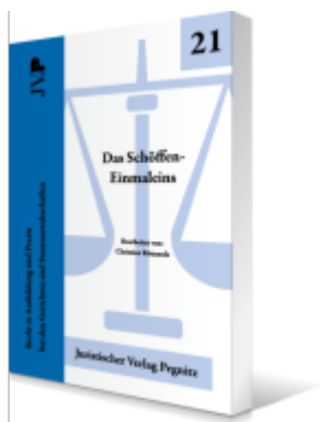
Das Schöff-Einmaleins Ladenpreis: 23,70EUR