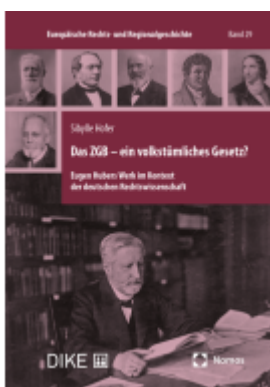
Das ZGB – ein volkstümliches Gesetz? Ladenpreis: 96,00EUR