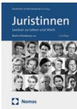
Juristinnen Ladenpreis: 101,80EUR