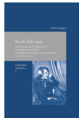
Recht hält jung Ladenpreis: 91,50EUR