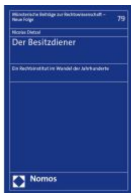
Der Besitzdiener Ladenpreis: 86,40EUR