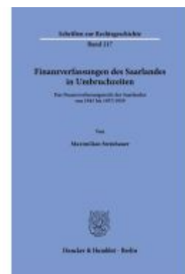
Finanzverfassungen des Saarlandes in Umbruchzeiten. Ladenpreis: 92,50EUR