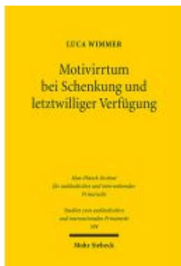
Motivirrtum bei Schenkung und letztwilliger Verfügung Ladenpreis: 76,10EUR

Wir haben andere Produkte gefunden, die Ihnen gefallen könnten!