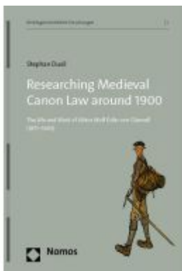
Researching Medieval Canon Law around 1900 Ladenpreis: 45,30EUR