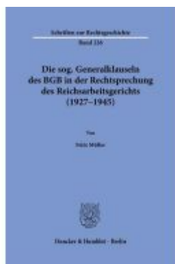
Die sog. Generalklauseln des BGB in der Rechtsprechung des Reichsarbeitsgerichts (1927-1945) Ladenpreis: 113,00EUR