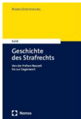
Geschichte des Strafrechts Ladenpreis: 30,80EUR