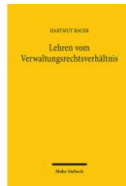
Lehren vom Verwaltungsrechtsverhältnis Ladenpreis: 81,30EUR