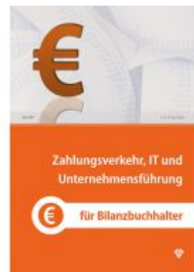
Zahlungsverkehr, IT und Unternehmensführung Ladenpreis: 39,00EUR