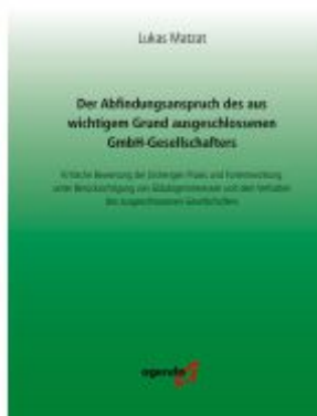
Der Abfindungsanspruch des aus wichtigem Grund ausgeschlossenen GmbH-Gesellschafters Ladenpreis: 66,80EUR