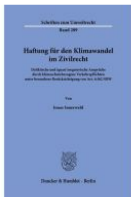
Haftung für den Klimawandel im Zivilrecht Ladenpreis: 113,00EUR