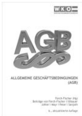
Allgemeine Geschäftsbedingungen (AGB) Ladenpreis: 20,00EUR