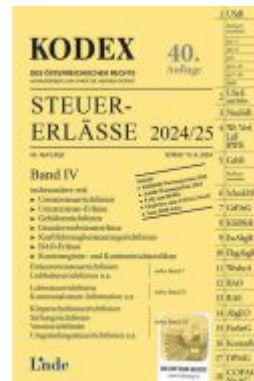
KODEX Steuer-Erlässe 2024/25, Band IV Ladenpreis: 67,00EUR