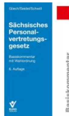
Sächsisches Personalvertretungsgesetz Ladenpreis: 56,50EUR