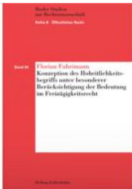
Konzeption des Hoheitlichkeitsbegriffs unter besonderer Berücksichtigung der Bedeutung im Freizügigkeitsrecht Ladenpreis: 75,00EUR