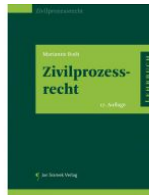
Zivilprozessrecht Ladenpreis: 55,00EUR