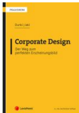
Corporate Design – Der Weg zum perfekten Erscheinungsbild Ladenpreis: 36,00EUR