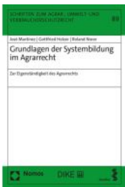
Grundlagen der Systembildung im Agrarrecht Ladenpreis: 74,10EUR