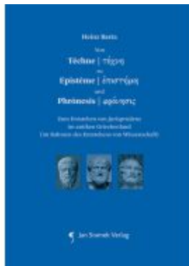
Von Téchne zu Epistème und Phrónesis Ladenpreis: 48,00EUR