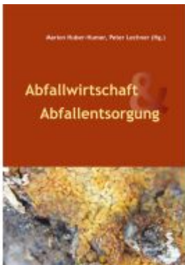
Abfallwirtschaft & Abfallentsorgung Ladenpreis: 32,00EUR

Wir haben andere Produkte gefunden, die Ihnen gefallen könnten!