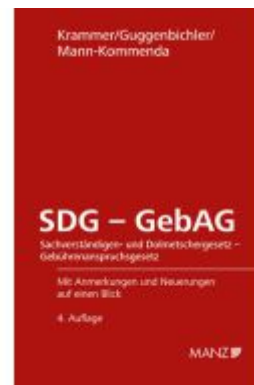
SDG - GebAG Sachverständigen- und DolmetscherG - GebührenanspruchG Ladenpreis: 28,80EUR