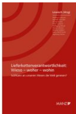
Lieferkettenverantwortlichkeit Wieso - woher - wohin Ladenpreis: 48,00EUR