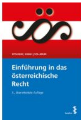
Einführung in das österreichische Recht Ladenpreis: 25,00EUR