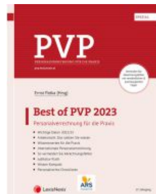
Best of PVP 2023 Ladenpreis: 34,00EUR