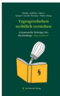
Tagesgeschehen rechtlich verstehen Ladenpreis: 14,90EUR