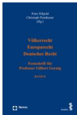
Völkerrecht – Europarecht – Deutsches Recht Ladenpreis: 162,00EUR

Wir haben andere Produkte gefunden, die Ihnen gefallen könnten!