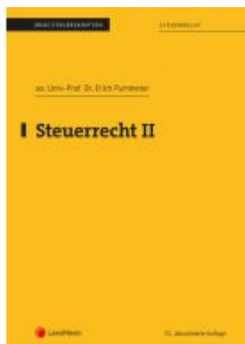
Steuerrecht II (Skriptum) Ladenpreis: 18,75EUR