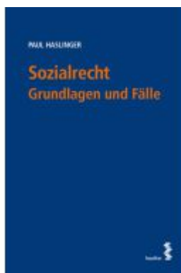
Sozialrecht Ladenpreis: 28,00EUR