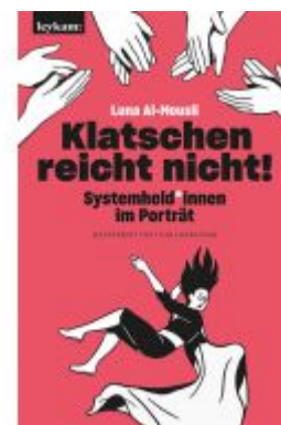
Klatschen reicht nicht! Ladenpreis: 22,00EUR