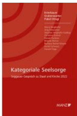
Kategoriale Seelsorge Seggauer Gespräch zu Staat und Kirche 2022 Ladenpreis: 28,00EUR