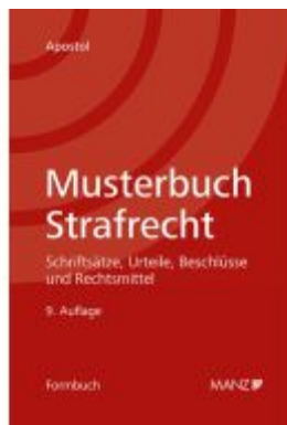
Musterbuch Strafrecht Ladenpreis: 108,00EUR