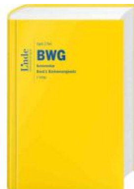
BWG | Bankwesengesetz Ladenpreis: 229,00EUR