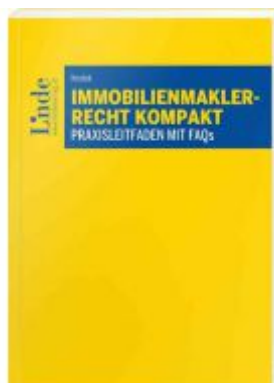
Immobilienmaklerrecht kompakt Ladenpreis: 39,00 EUR