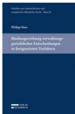
Bindungswirkung verwaltungsgerichtlicher Entscheidungen in fortgesetzten Verfahren Ladenpreis: 89,00 EUR