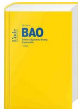
BAO | Bundesabgabenordnung Ladenpreis: 298,00 EUR