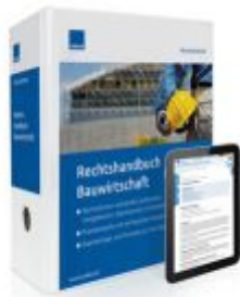
Rechtshandbuch Bauwirtschaft Ladenpreis: 207,90 EUR