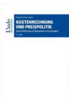
Kostenrechnung und Preispolitik Ladenpreis: 42,00 EUR