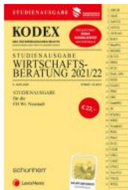
KODEX Wirtschaftsberatung 2021 - inkl. App Ladenpreis: 22,00 EUR

Wir haben andere Produkte gefunden, die Ihnen gefallen könnten!