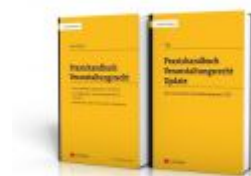
Praxishandbuch Veranstaltungsrecht + Update Ladenpreis: 79,00 EUR