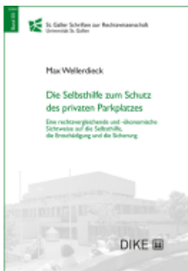
Die Selbsthilfe zum Schutz des privaten Parkplatzes Ladenpreis: 92,00EUR

Wir haben andere Produkte gefunden, die Ihnen gefallen könnten!