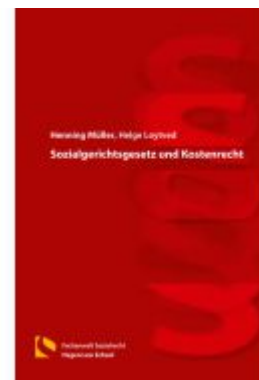
Sozialgerichtsgesetz und Kostenrecht Ladenpreis: 40,10EUR