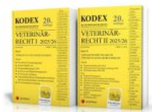
KODEX Veterinärrecht I+II 2025 Ladenpreis: 99,00EUR