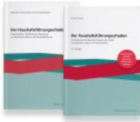
Der Haushaltsführungsschaden – Kombipaket Ladenpreis: 75,90EUR