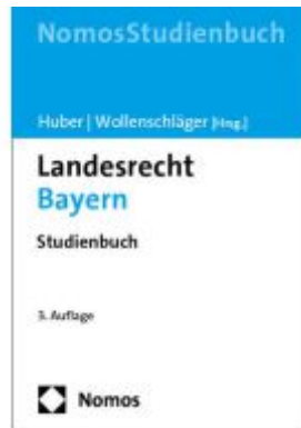
Landesrecht Bayern Ladenpreis: 35,90EUR