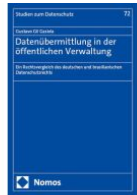
Datenübermittlung in der öffentlichen Verwaltung Ladenpreis: 112,10EUR