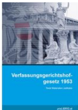
Verfassungsgerichtshofgesetz 1953 Ladenpreis: 23,00EUR