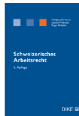
Schweizerisches Arbeitsrecht Ladenpreis: 104,00EUR