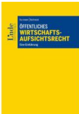
Öffentliches Wirtschaftsaufsichtsrecht Ladenpreis: 28,00EUR

Wir haben andere Produkte gefunden, die Ihnen gefallen könnten!