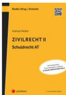
Zivilrecht II - Schuldrecht Allgemeiner Teil Ladenpreis: 42,00EUR