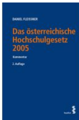
Das österreichische Hochschulgesetz 2005 Ladenpreis: 72,00EUR