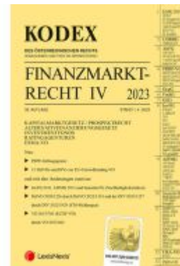
KODEX Finanzmarktrecht Band IV 2023 Ladenpreis: 86,00EUR