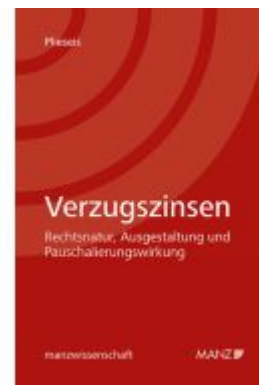
Verzugszinsen Ladenpreis: 74,00EUR