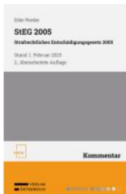
StEG 2005 Strafrechtliches Entschädigungsgesetz 2005 Ladenpreis: 58,00EUR