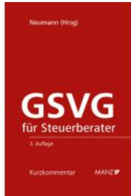
GSVG für Steuerberater Ladenpreis: 198,00EUR