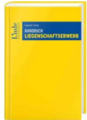
Handbuch Liegenschaftserwerb Ladenpreis: 49,00EUR