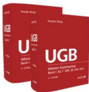
Wiener Kommentar zum UGB PAKET Band 1 + Band 2 Ladenpreis: 578,00EUR

Wir haben andere Produkte gefunden, die Ihnen gefallen könnten!