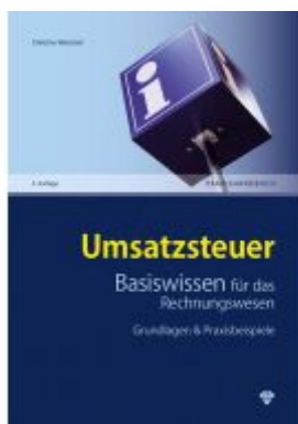
Umsatzsteuer Basiswissen für das Rechnungswesen Ladenpreis: 44,00EUR