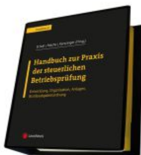
Handbuch zur Praxis der steuerlichen Betriebsprüfung Ladenpreis: 440,00EUR