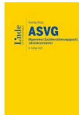
ASVG | Allgemeines Sozialversicherungsgesetz 2023 Ladenpreis: 187,00EUR