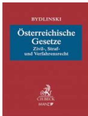
Österreichische Gesetze Ladenpreis: 148,00 EUR