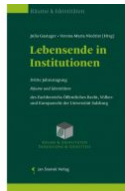
Lebensende in Institutionen Ladenpreis: 55,00 EUR