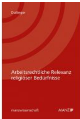
Arbeitsrechtliche Relevanz religiöser Bedürfnisse Ladenpreis: 74,00 EUR