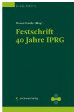
Festschrift 40 Jahre IPRG Ladenpreis: 98,00 EUR