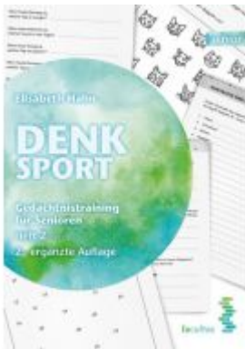
Denksport Ladenpreis: 14,90 EUR