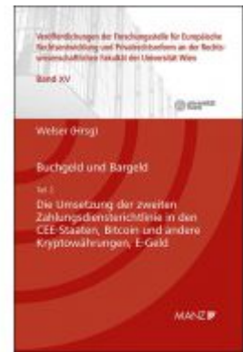
Buchgeld und Bargeld - Teil 2: Die Umsetzung der zweiten Zahlungsdiensterichtlinie in den CEE- Staaten Ladenpreis: 64,00 EUR