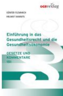
Einführung in das Gesundheitsrecht und die Gesundheitsökonomie Ladenpreis: 59,00 EUR