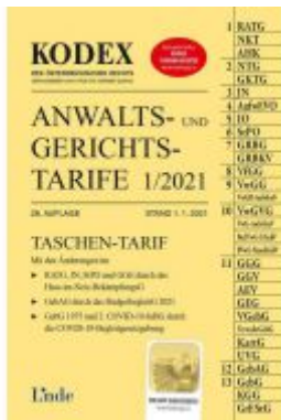
KODEX Anwalts- und Gerichtstarife 1/2021 Ladenpreis: 29,50 EUR