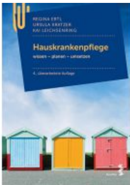
Hauskrankenpflege Ladenpreis: 24,90 EUR

Wir haben andere Produkte gefunden, die Ihnen gefallen könnten!