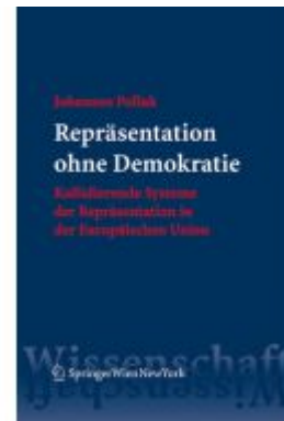
Repräsentation ohne Demokratie Ladenpreis: 89,95 EUR