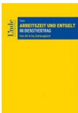
Arbeitszeit und Entgelt im Dienstvertrag Ladenpreis: 32,00 EUR