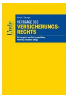
Verträge des Versicherungsrechts Ladenpreis: 48,00 EUR