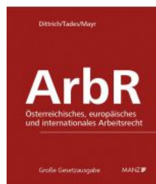
Arbeitsrecht Ladenpreis: 338,00 EUR