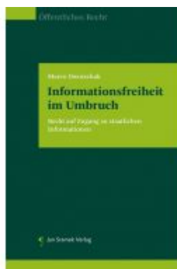
Informationsfreiheit im Umbruch Ladenpreis: 98,00 EUR