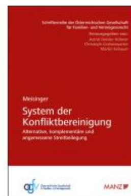
System der Konfliktbereinigung Ladenpreis: 48,00 EUR