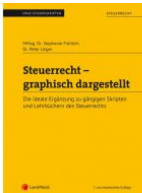
Steuerrecht - graphisch dargestellt (Skriptum) Ladenpreis: 22,00 EUR

Wir haben andere Produkte gefunden, die Ihnen gefallen könnten!