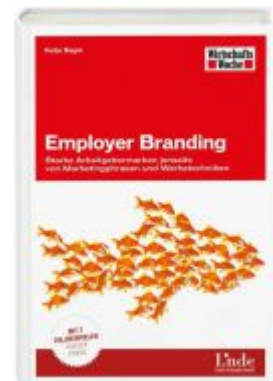
Employer Branding Ladenpreis: 24,90 EUR