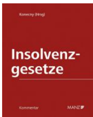
Kommentar zu den Insolvenzgesetzen Ladenpreis: 380,00 EUR