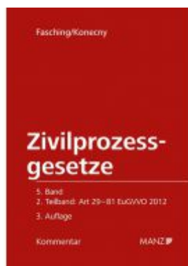
Kommentar zu den Zivilprozessgesetzen Art 29-81 EuGVVO 2012 ZPO Ladenpreis: 142,00 EUR