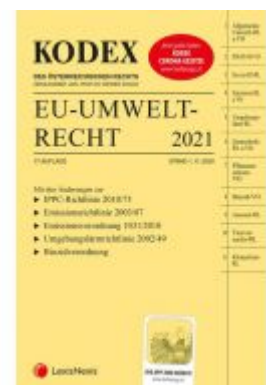
KODEX EU-Umweltrecht 2021 Ladenpreis: 103,00 EUR

Alle Preise inkl. MwSt. zzgl. Versand. Bei Bestellung im LexisNexis Onlineshop kostenloser Versand innerhalb Österreichs.