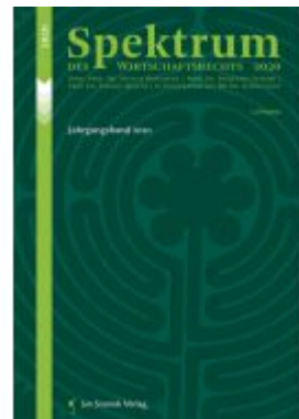
Spektrum des Wirtschaftsrechts Ladenpreis: 85,00 EUR