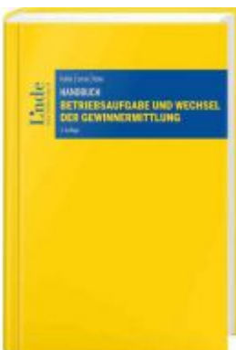
Handbuch Betriebsaufgabe und Wechsel der Gewinnermittlung Ladenpreis: 64,00 EUR