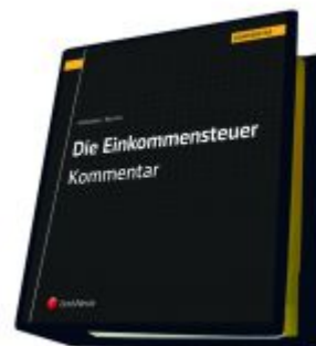
Die Einkommensteuer (EStG 1988) Band III - Kommentar Ladenpreis: 496,00 EUR