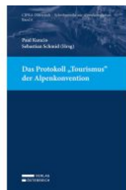
Das Protokoll "Tourismus" der Alpenkonvention Ladenpreis: 42,00 EUR