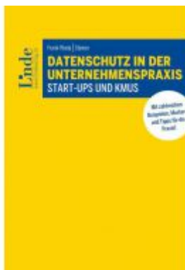
Datenschutz in der Unternehmenspraxis Ladenpreis: 55,00 EUR