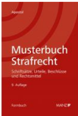
Musterbuch Strafrecht Ladenpreis: 108,00 EUR

Wir haben andere Produkte gefunden, die Ihnen gefallen könnten!