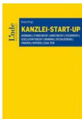
Kanzlei-Start-up Ladenpreis: 46,00 EUR