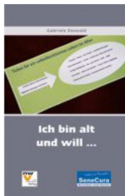
Ich bin alt und will ... Ladenpreis: 24,80 EUR