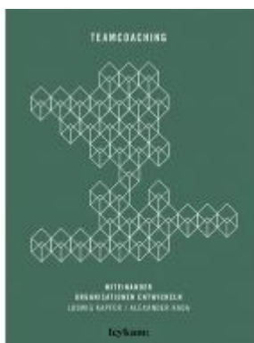
Teamcoaching – Miteinander Organisationen entwickeln Ladenpreis: 28,00 EUR