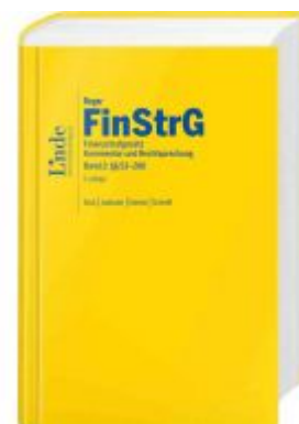
FinStrG | Finanzstrafgesetz Ladenpreis: 220,00 EUR