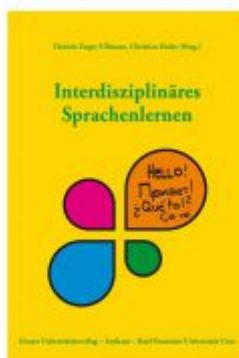
Interdisziplinäres Sprachenlernen Ladenpreis: 19,90 EUR