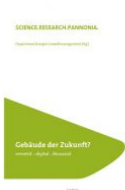
Gebäude der Zukunft? vernetzt – digital – ökosozial Ladenpreis: 24,90 EUR

Wir haben andere Produkte gefunden, die Ihnen gefallen könnten!