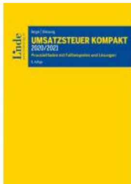
Umsatzsteuer kompakt 2020/2021 Ladenpreis: 59,00 EUR