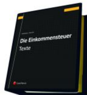
Die Einkommensteuer (EStG 1988) Band I - Texte Ladenpreis: 287,00 EUR