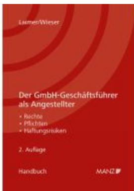
Der GmbH-Geschäftsführer als Angestellter Ladenpreis: 46,00EUR