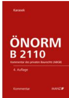
ÖNORM B 2110 Ladenpreis: 298,00EUR