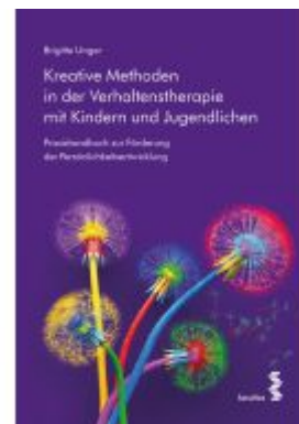
Kreative Methoden in der Verhaltenstherapie mit Kindern und Jugendlichen Ladenpreis: 23,90EUR