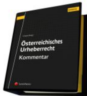
Österreichisches Urheberrecht Ladenpreis: 289,00EUR