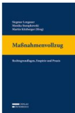
Maßnahmenvollzug Ladenpreis: 119,00EUR