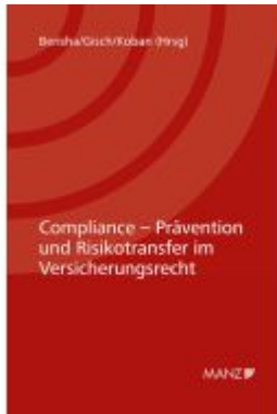
Compliance - Prävention und Risikotransfer im Versicherungsrecht 7. Kremser Versicherungsforum 2021 Ladenpreis: 36,00EUR