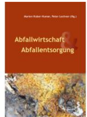
Abfallwirtschaft & Abfallentsorgung Ladenpreis: 32,00EUR