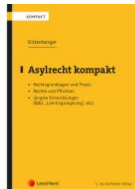
Asylrecht kompakt Ladenpreis: 34,00 EUR