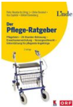
Der Pflege-Ratgeber Ladenpreis: 29,90EUR