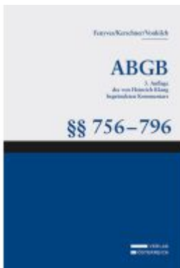
Großkommentar zum ABGB - Klang Kommentar Ladenpreis: 138,00EUR