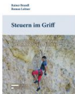
Steuern im Griff Ladenpreis: 49,00 EUR