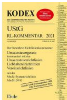
KODEX UStG-Richtlinien-Kommentar 2021 Ladenpreis: 53,00 EUR