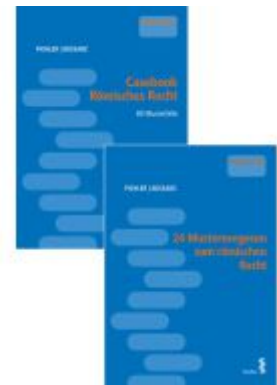
Kombipaket Casebook Römisches Recht und 24 Musterexegesen zum römischen Recht Ladenpreis: 58,00EUR