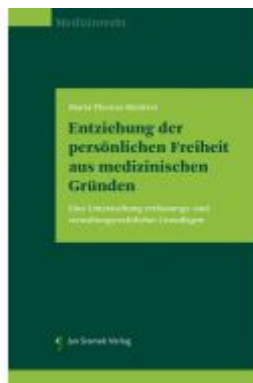
Entziehung der persönlichen Freiheit aus medizinischen Gründen Ladenpreis: 85,00EUR