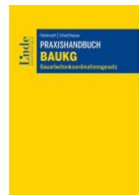
Praxishandbuch BauKG Ladenpreis: 49,00EUR