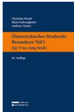
Österreichisches Strafrecht. Besonderer Teil I (§§ 75 bis 168g StGB) Ladenpreis: 39,00EUR