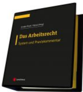
Das Arbeitsrecht - System und Praxiskommentar Ladenpreis: 325,00 EUR