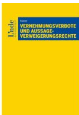
Vernehmungsverbote und Aussageverweigerungsrechte Ladenpreis: 29,00EUR