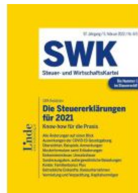
Die Steuererklärungen für 2021 Ladenpreis: 43,00EUR