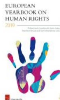
European Yearbook on Human Rights 2019 Ladenpreis: 89,00 EUR