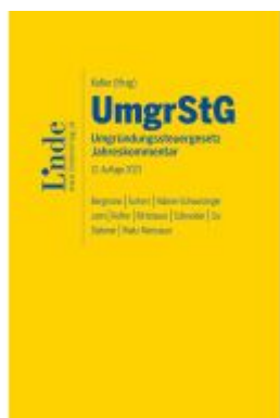
UmgrStG | Umgründungssteuergesetz 2023 Ladenpreis: 255,00EUR