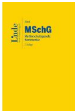
MSchG | Mutterschutzgesetz Ladenpreis: 69,00 EUR

Wir haben andere Produkte gefunden, die Ihnen gefallen könnten!