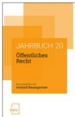
Öffentliches Recht Ladenpreis: 68,00 EUR