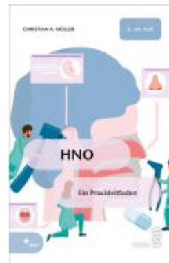
HNO Ladenpreis: 14,90EUR