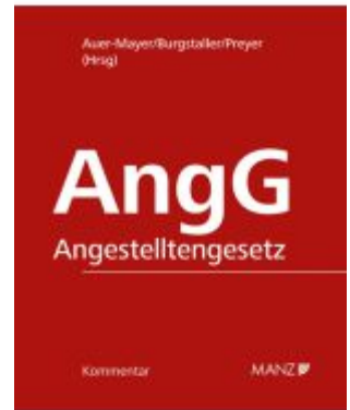
Kommentar zum Angestelltengesetz AngG Ladenpreis: 168,00EUR