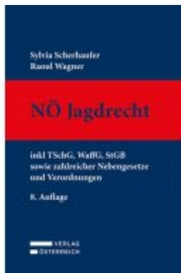
Nö Jagdrecht Ladenpreis: 189,00EUR