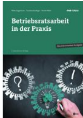
Betriebsratsarbeit in der Praxis Ladenpreis: 39,00EUR