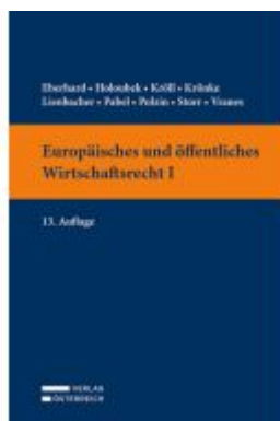
Europäisches und öffentliches Wirtschaftsrecht I Ladenpreis: 39,00EUR