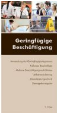
Geringfügige Beschäftigung Ladenpreis: 13,20EUR