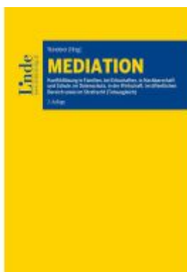
Mediation Ladenpreis: 68,00EUR