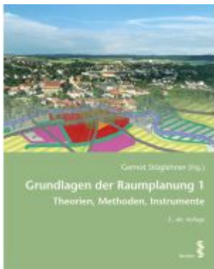
Grundlagen der Raumplanung 1 Ladenpreis: 32,00EUR

Wir haben andere Produkte gefunden, die Ihnen gefallen könnten!