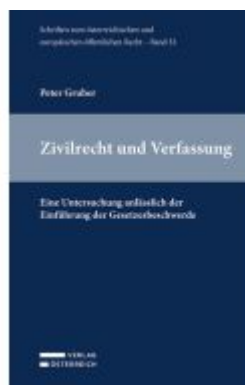
Zivilrecht und Verfassung Ladenpreis: 58,00EUR