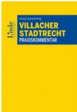
Villacher Stadtrecht Ladenpreis: 55,00 EUR