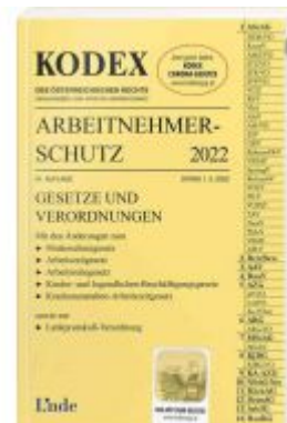
KODEX Arbeitnehmerschutz 2022 Ladenpreis: 39,00 EUR