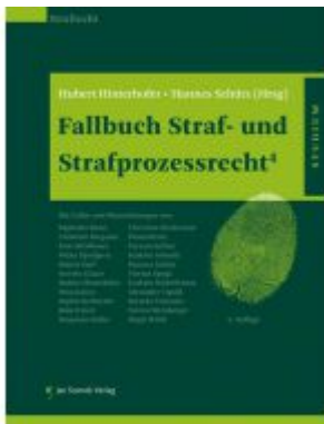
Fallbuch Straf- und Strafprozessrecht4 Ladenpreis: 42,50 EUR

Wir haben andere Produkte gefunden, die Ihnen gefallen könnten!