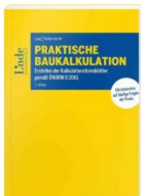
Praktische Baukalkulation Ladenpreis: 64,00 EUR