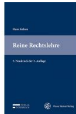
Reine Rechtslehre Ladenpreis: 79,00 EUR