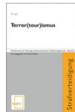
Terror(tour)ismus Ladenpreis: 68,00 EUR