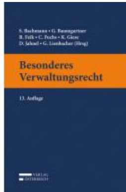
Besonderes Verwaltungsrecht Ladenpreis: 55,00 EUR