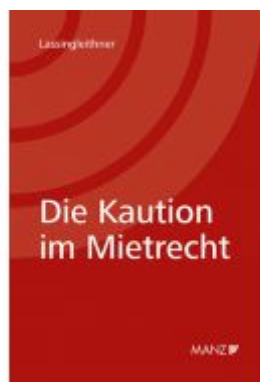
Die Kautio n im Mietrecht Ladenpreis: 52,00 EUR