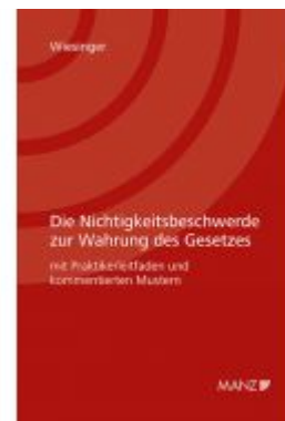
Die Nichtigkeitsbeschwerde zur Wahrung des Gesetzes Ladenpreis: 48,00 EUR