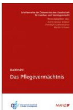
Das Pflegevermächtnis Ladenpreis: 39,80 EUR