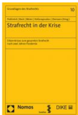
Strafrecht in der Krise Ladenpreis: 70,00 EUR