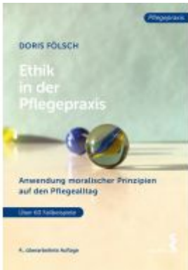
Ethik in der Pflegepraxis Ladenpreis: 25,90 EUR