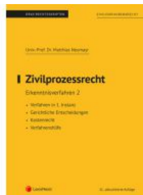
Zivilprozessrecht Erkenntnisverfahren 2 (Skriptum) Ladenpreis: 26,25EUR