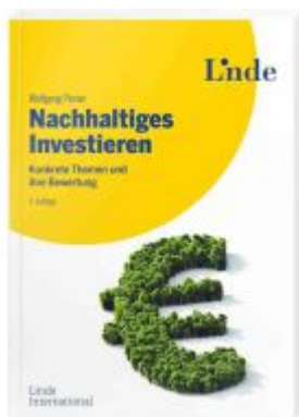
Nachhaltiges Investieren Ladenpreis: 39,00EUR