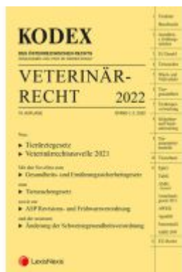
KODEX Veterinärrecht 2022 Ladenpreis: 96,00EUR