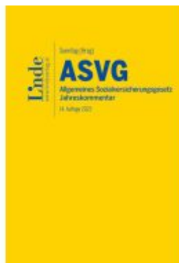
ASVG | Allgemeines Sozialversicherungsgesetz 2023 Ladenpreis: 187,00EUR