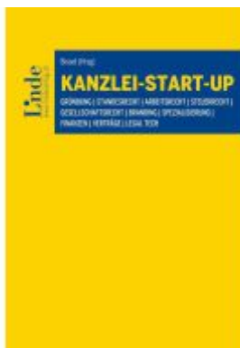
Kanzlei-Start-up Ladenpreis: 46,00EUR