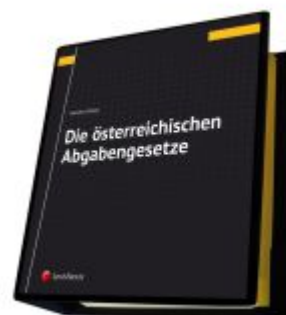
Die österreichischen Abgabengesetze Ladenpreis: 142,00EUR