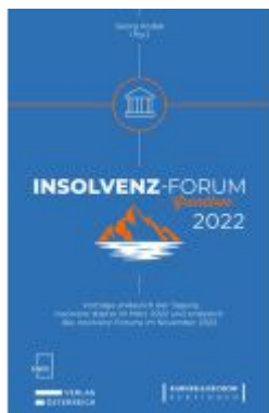
Insolvenz-Forum 2022 Ladenpreis: 78,00EUR

Wir haben andere Produkte gefunden, die Ihnen gefallen könnten!