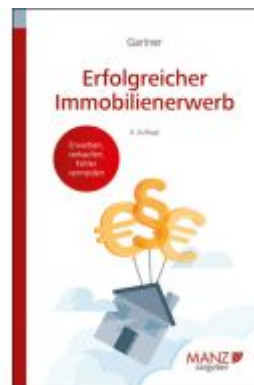
Erfolgreicher Immobilienerwerb Ladenpreis: 23,80EUR