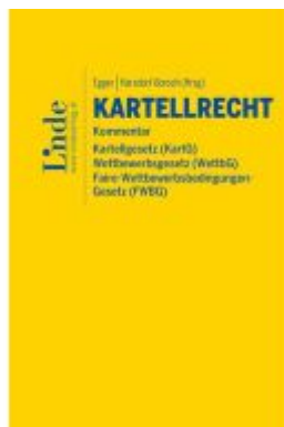
Kartellrecht Kommentar Ladenpreis: 290,00EUR