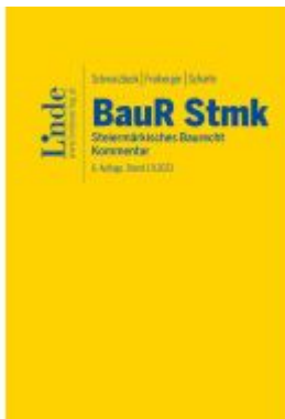
BauR Stmk. | Steiermärkisches Baurecht Ladenpreis: 249,00EUR

Wir haben andere Produkte gefunden, die Ihnen gefallen könnten!