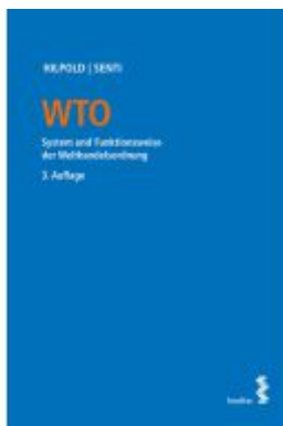
WTO Ladenpreis: 86,00EUR