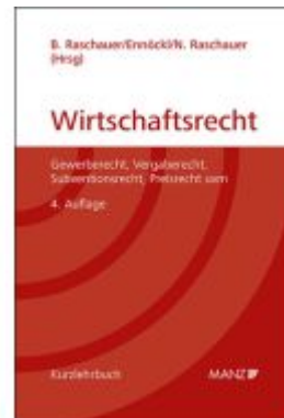
Grundriss des österreichischen Wirtschaftsrechts Ladenpreis: 93,00EUR