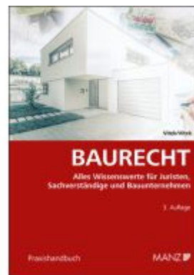
Baurecht Ladenpreis: 48,00EUR