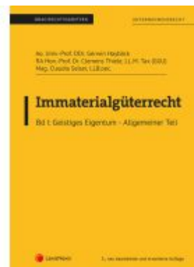
Immaterialgüterrecht (Skriptum) - Bd I Ladenpreis: 13,00EUR