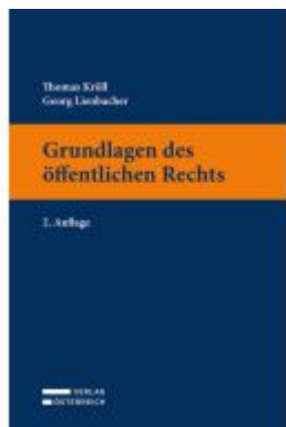
Grundlagen des öffentlichen Rechts Ladenpreis: 35,00EUR