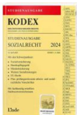
KODEX Studienausgabe Sozialrecht 2024 Ladenpreis: 15,00EUR