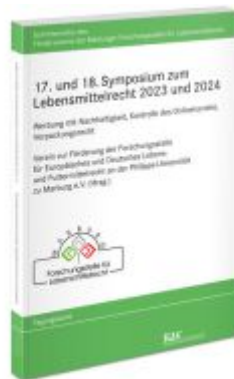
17. und 18. Symposium zum Lebensmittelrecht 2023 und 2024 Ladenpreis: 71,00EUR