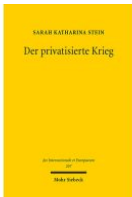
Der privatisierte Krieg Ladenpreis: 107,00EUR