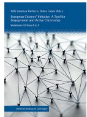
European Citizens' Initiative: A Tool for Engagement and Active Citizenship Ladenpreis: 32,90EUR