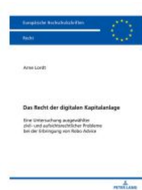
Das Recht der digitalen Kapitalanlage Ladenpreis: 63,70EUR