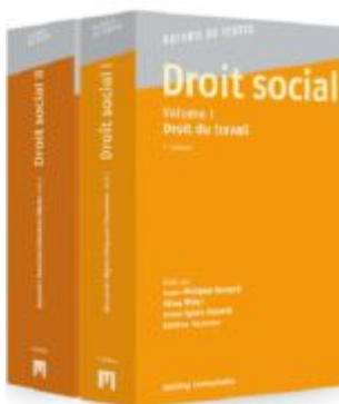
Droit social, Volumes I et II Ladenpreis: 108,00EUR