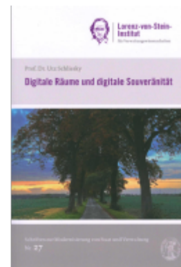
Digitale Räume und digitale Souveränität Ladenpreis: 13,30EUR