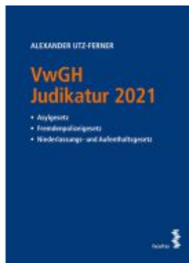
VwGH Judikatur 2021 Ladenpreis: 78,00EUR