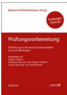
Prüfungsvorbereitung Einführung in die Rechtswissenschaften und ihre Methoden Ladenpreis: 21,40EUR