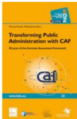
Transforming Public Administration with CAF Ladenpreis: 46,80 EUR