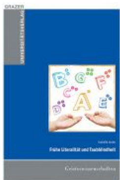
Frühe Literalität und Taubblindheit Ladenpreis: 12,90 EUR