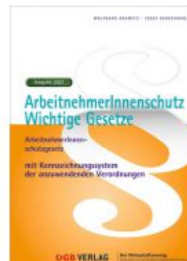
ArbeitnehmerInnenschutz. Ladenpreis: 39,90 EUR