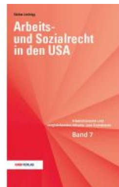
Arbeits- und Sozialrecht in den USA Ladenpreis: 29,90 EUR