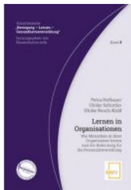
Lernen in Organisationen Ladenpreis: 28,80 EUR