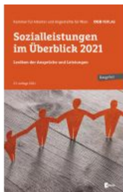
Sozialleistungen im Überblick 2021 Ladenpreis: 29,90 EUR