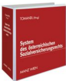
System des österreichischen Sozialversicherungsrechts Ladenpreis: 258,00 EUR