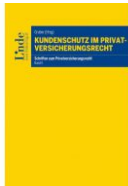
Kundenschutz im Privatversicherungsrecht Ladenpreis: 36,00 EUR