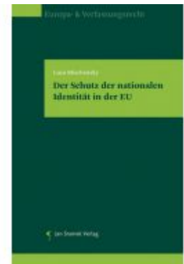
Der Schutz der nationalen Identität in der EU Ladenpreis: 78,00 EUR