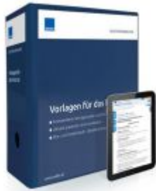
Vorlagen für das Notariat Ladenpreis: 233,26 EUR

Wir haben andere Produkte gefunden, die Ihnen gefallen könnten!