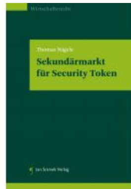
Sekundärmarkt für Security Token Ladenpreis: 29,90 EUR