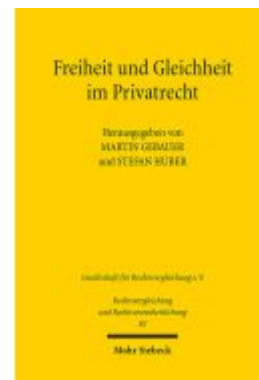
Freiheit und Gleichheit im Privatrecht Ladenpreis: 81,30EUR