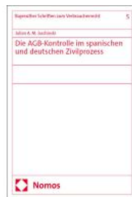
Die AGB-Kontrolle im spanischen und deutschen Zivilprozess Ladenpreis: 168,60EUR