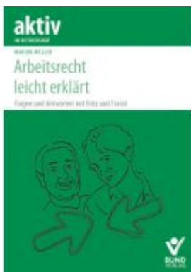
Arbeitsrecht leicht erklärt Ladenpreis: 25,60EUR