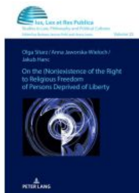
On the (non)existence of the right to religious freedom of persons deprived of liberty Ladenpreis: 61,60EUR