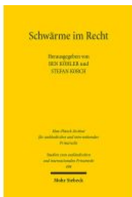
Schwärme im Recht Ladenpreis: 76,10EUR