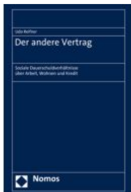
Der andere Vertrag Ladenpreis: 142,90EUR