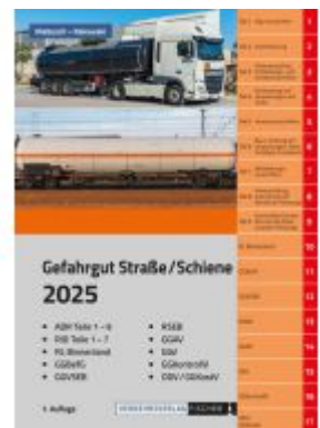
ADR/RID 2025 - 1. Auflage Ladenpreis: 60,30EUR