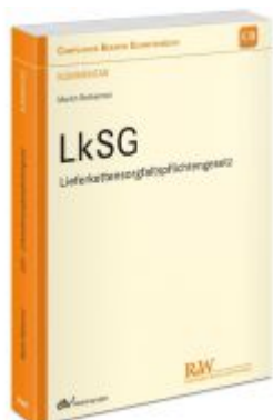
LkSG - Lieferkettensorgfaltspflichtengesetz Ladenpreis: 112,10EUR

Wir haben andere Produkte gefunden, die Ihnen gefallen könnten!