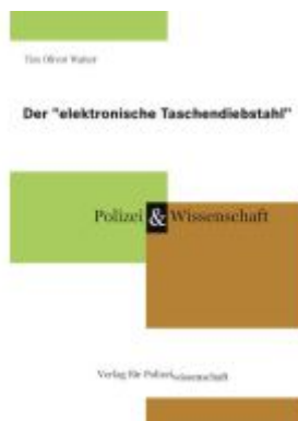
Der "elektronische Taschendiebstahl" Ladenpreis: 20,40EUR