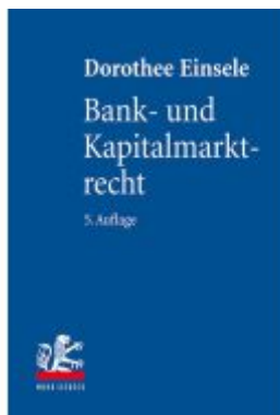
Bank- und Kapitalmarktrecht Ladenpreis: 153,20EUR