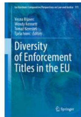
Diversity of Enforcement Titles in the EU Ladenpreis: 186,99EUR