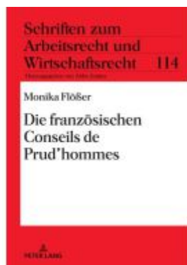
Die französischen Conseils de Prud'hommes Ladenpreis: 56,50EUR