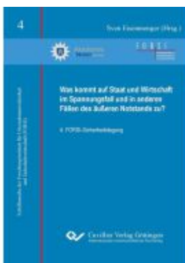
Was kommt auf Staat und Wirtschaft im Spannungsfall und in anderen Fällen des äußeren Notstands zu? Ladenpreis: 14,80EUR