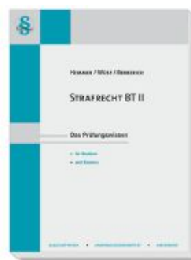
Strafrecht BT II Ladenpreis: 23,60EUR