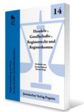
Handels-, Gesellschafts-, Registerrecht und Registerkosten Ladenpreis: 25,70EUR