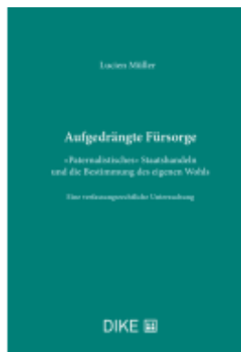
Aufgedrängte Fürsorge Ladenpreis: 184,00EUR