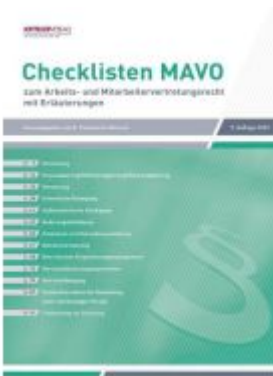
Checklisten MAVO Ladenpreis: 29,80EUR