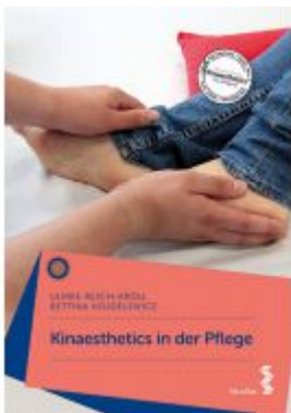
Kinaesthetics in der Pflege Ladenpreis: 29,90 EUR

Wir haben andere Produkte gefunden, die Ihnen gefallen könnten!