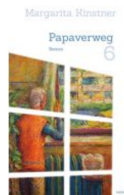
Papaverweg 6 Ladenpreis: 19,90 EUR