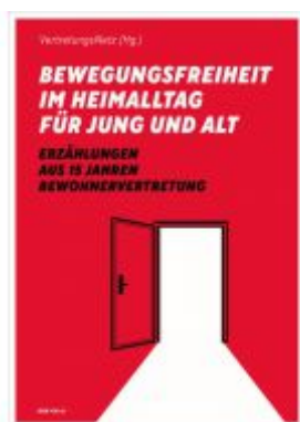
Bewegungsfreiheit im Heimalltag für Jung und Alt Ladenpreis: 19,90 EUR