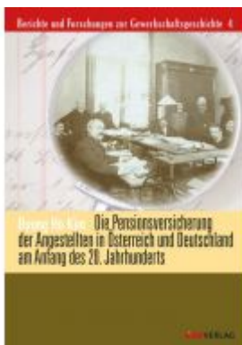
Die Pensionsversicherung der Angestellten in Österreich und Deutschland am Anfang des 20. Jahrhunderts Ladenpreis: 36,00 EUR