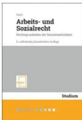
Arbeits- und Sozialrecht Ladenpreis: 32,00 EUR