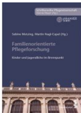
Familienorientierte Pflegeforschung Ladenpreis: 9,90 EUR