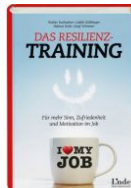
Das Resilienz-Training Ladenpreis: 24,90 EUR