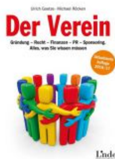
Der Verein Ladenpreis: 12,90 EUR